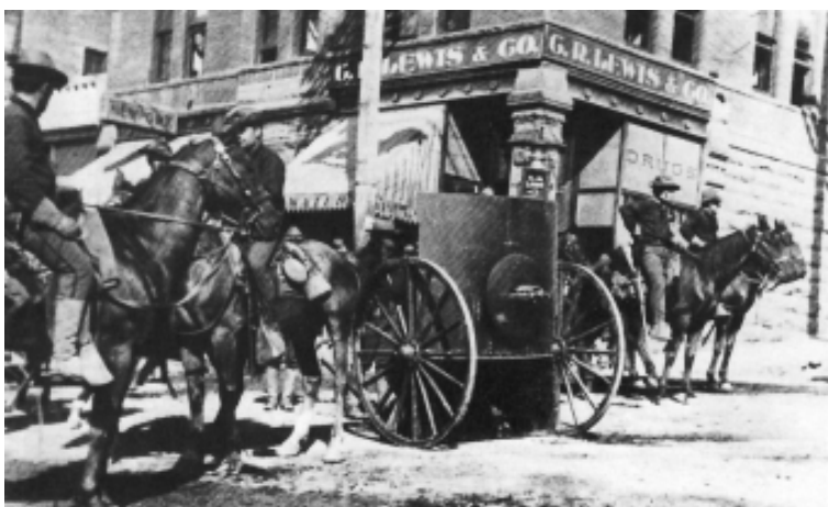
Militären sattes in för att kväsa gruvarbetarnas strejk i Cripple Creek i Colorado.

Skottlossning förekom vid flera tillfällen mellan strejkvakter och strejkbrytare. De strejkande saboterade i november ett järnvägsspår, vilket kunde ha lett till en katastrof om dådet inte hade upptäckts i tid. En explosion i en av gruvorna ledde till att två förmän miste livet. Arbetsgivarna anklagade de strejkande för sabotage medan facket påstod att olyckan hade inträffat då de två omkomna försökte arrangera en sprängning som skulle skyllas på de strejkande. I en annan olycka i Independence-gruvan dödades 15 strejkbrytare då en kabel brast. Det påstods att det handlade om sabotage.